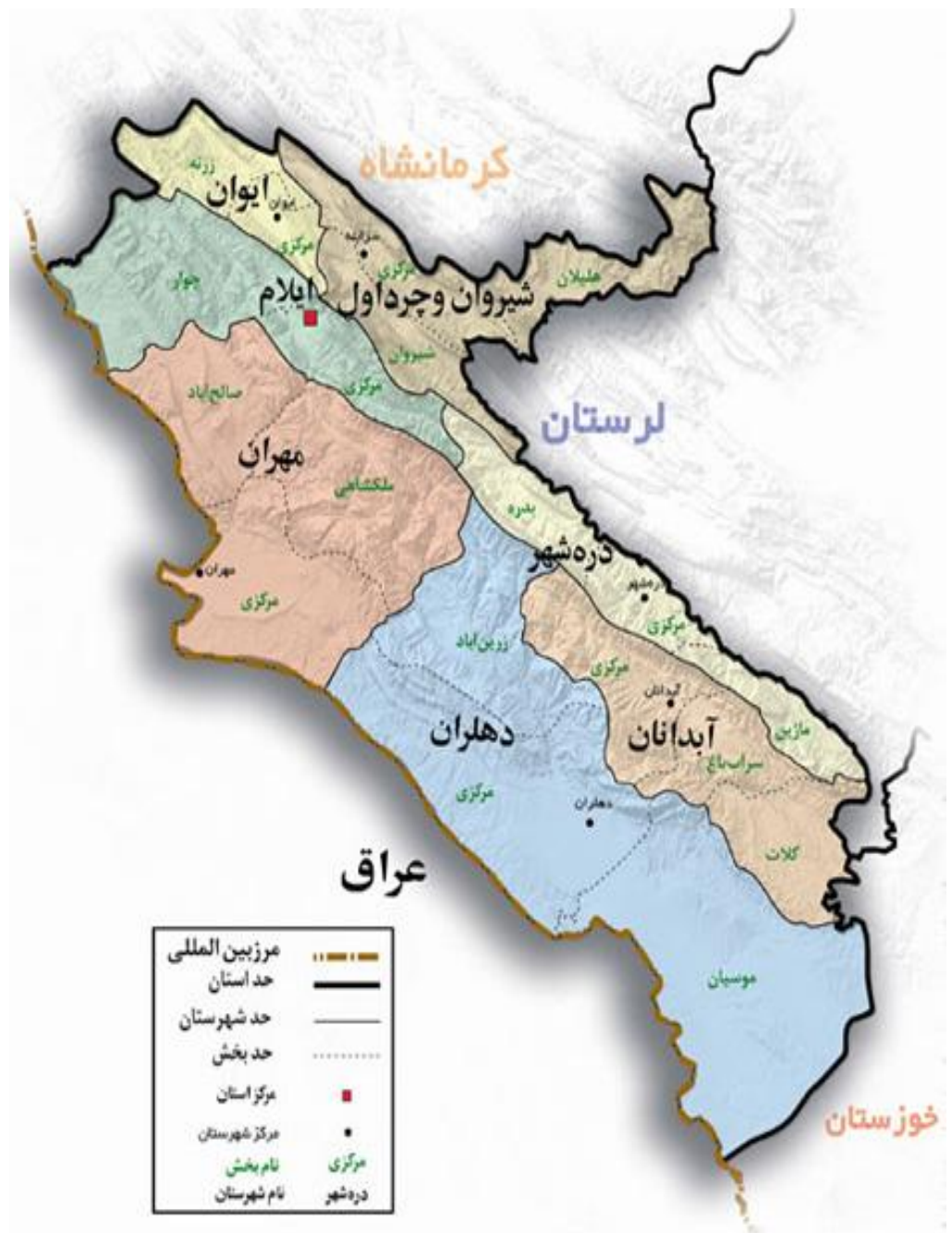
پیوست 2: نقشه استان ایلام، شهرستان آبدانان